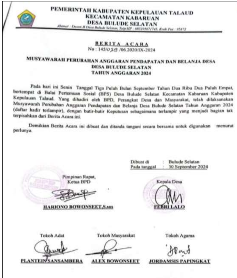
Gambar 5. Cuplikan Berita Acara Musyawarah Desa

Berita acara musyawarah desa merupakan bukti pelaksanaan partisipasi masyarakat dalam proses pengambilan keputusan terkait Dana Desa.