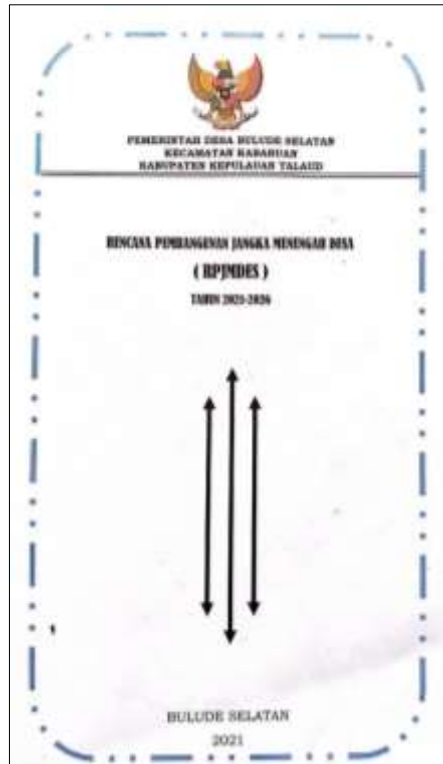
Gambar 2. Cuplikan Halaman RPJMDes Desa Bulude Selatan Tahun 2021-2022

Dokumen RPJMDes merupakan perencanaan jangka menengah desa yang berisi arah kebijakan pembangunan untuk jangka waktu enam tahun, dokumen ini menjadi pedoman bagi pemerintah desa dalam menetapkan program dan kegiatan prioritas yang akan dilaksanakan setiap tahun.