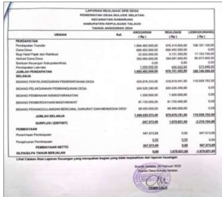
Gambar 4. Cuplikan Realisasi APBDes Desa Bulude Selatan Tahun 2025

Dokumen ini menunjukkan rincian pendapatan, belanja dan pembiayaan desa Bulude Selatan untuk tahun anggaran 2024. Berdasarkan laporan tersebut, dapat diketahui bahwa sebagian besar pendapatan desa bersumber dari Dana Desa (DDS) dan Alokasi Dana Desa (ADD). Realisasi anggaran digunakan untuk empat bidang utama, yaitu penyelenggaraan pemerintahan desa, pelaksanaan pembangunan, pembinaan kemasyarakatan, serta penanggulangan bencana. Dokumen ini juga menampilkan tanda tangan kepala desa, sebagai bukti bahwa laporan keuangan telah disahkan dan dipertanggungjawabkan secara administratif.